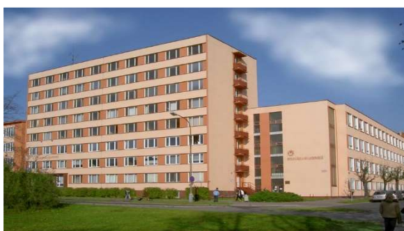
hlavní budova školy U Borského parku 3, Plzeň