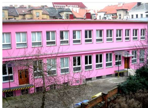
odlučené pracoviště Bendova 22, Plzeň